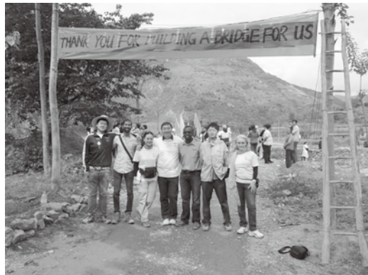
CCOUC 災害與人道救援研究所及牛津大學的師生到甘肅一條村落為村民進行健康教育

香港人生活在經濟富庶地區，享受良好的社會及醫療服務，更應該積極投身人道救援工作，履行世界公民的義務。作為世界公民和資源豐富地區的居民，本着對人類生命的尊重和世界大同的普世價值觀，為自己國家內外遭受貧苦、災難和戰亂的