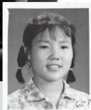
十七歲時的作者沒想過要當作家啊