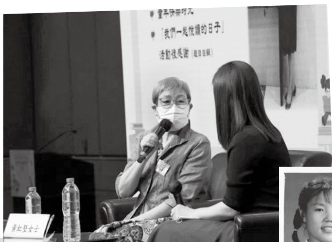
作者在疫情中參加書展